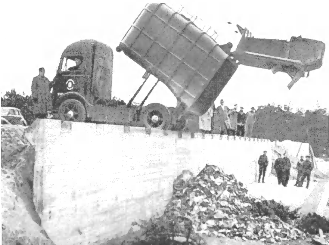
De eerste wagen huisvuil wordt gestort