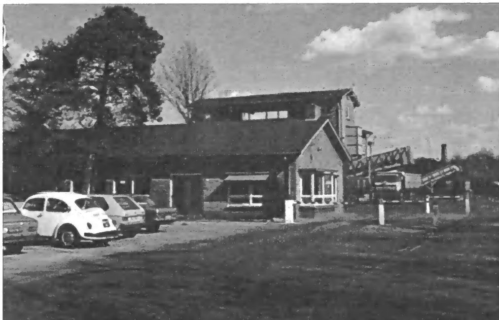
het kantoor van de VAM