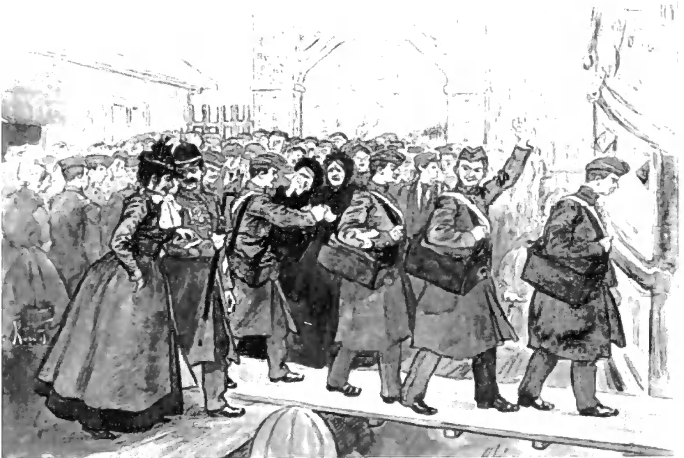
De inscheping naar Atjeh.