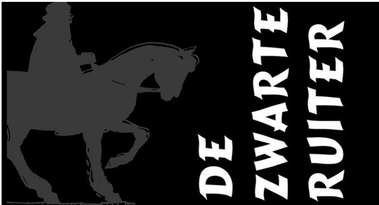
(affiche Toneelgroep St. Genesius, Helmond)