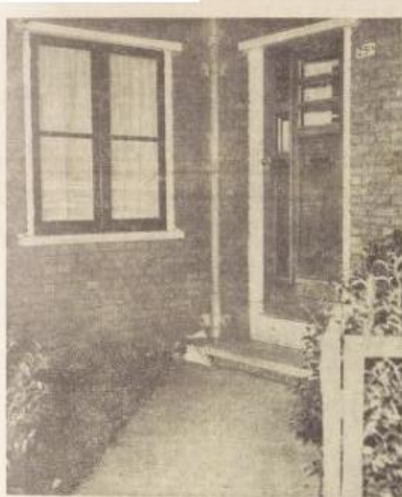
Voor deze deur stond vrijdagochtend de Zwarte Ruiter. Laat nu kinnen dit... 's Avonds ver schoen bij verrassing de politie en geboeld kwam de Zwarte Ruiter de deur weer uit.

Er is geen sprake geweest van een vechtpartij, zo deelde zij mee. „Wagena zijn er bij de inval van beide kanten niet gelicht.” „Het is verachtkelk,” zo zette zij. „Wij zijn op ons wel heel vervelede manier in deze zaak betrokken.”