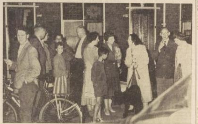
In de rustige stadswijk Hillegersberg werd besond door een man en een vrouw, die in de buurt bijzonder gunstig bekend staan, maar die geens in afzondering leven. De Zwarte Ruiter kende de man, sekere B. uit zijn Scheveningse gevangenschap, zij waren destijds celgenoten. B. is in laatste goede doen, hij srijn een vreeswarentalaker.